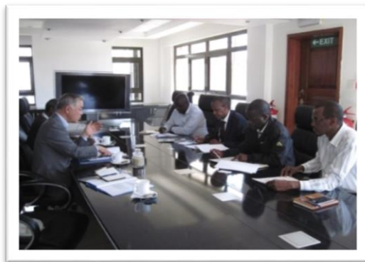
ケニア、通信建設業者との意見交換