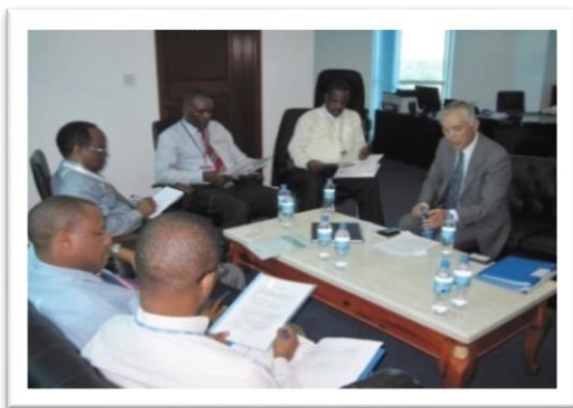
タンザニア、政府機関との意見交換