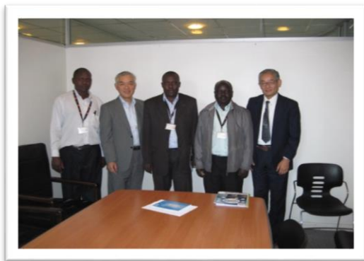
ケニア、通信事業者との意見交換