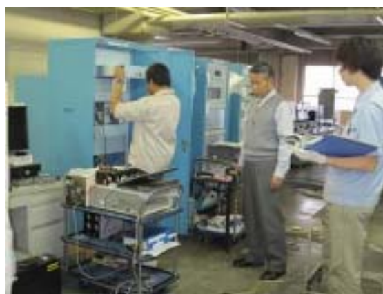
Audio Matrix 装置の工場検査立会風景