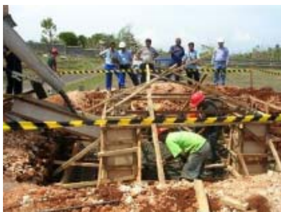
新送信所(2級局)の鉄塔(20m)基礎工事（バリ島）