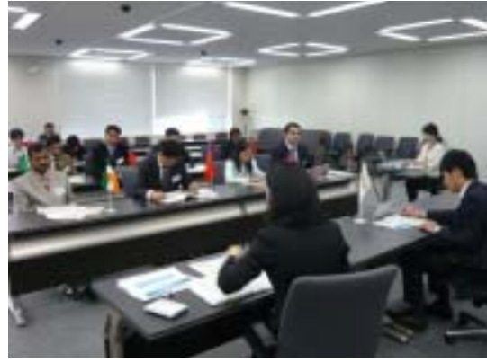
総務省での受講風景