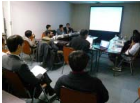
JTECでの各研修員からの各国ナショナル データベース導入状況の発表と 意見交換