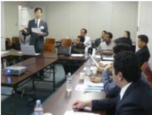
JTECでのディスカッション セッション風景