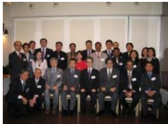
修了式を終えての記念撮影