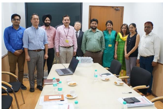
インド保健家族福祉省訪問