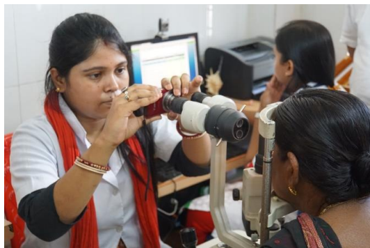
村の眼科技師が検査機を通して患者の眼の写真を撮影し州都眼科病院へ送信