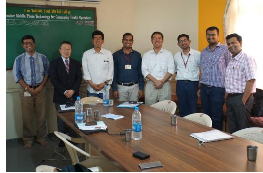
SEWA Rural (医療 NGO) 訪問