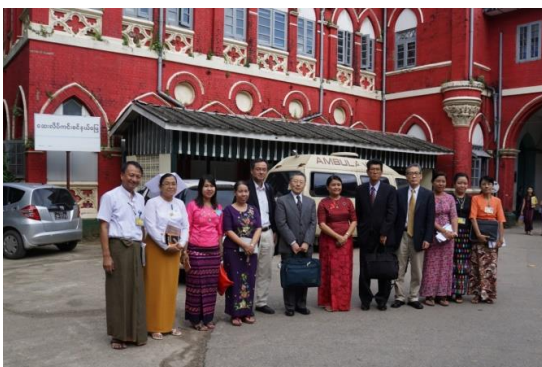
ヤンゴン中央女性病院訪問