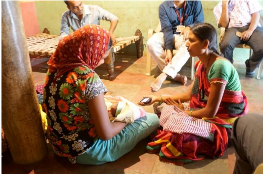
ヘルスワーカーがモバイルヘルスアプリケーションを持って産婦・乳児宅訪問