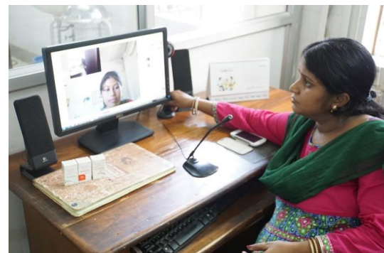
受信した眼の写真についてビデオコンサルテーションを用いて村の担当者と話し合う州都眼科病院側の様子