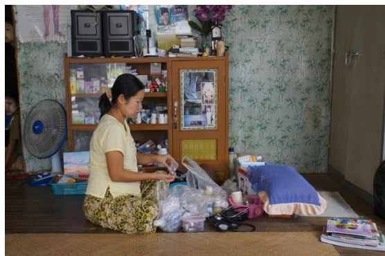
ミャンマーの村の助産師訪問