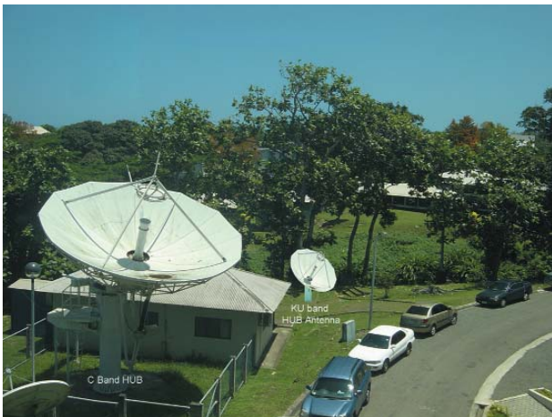
写真3. 敷地内設置の衛星通信アンテナ

写真3は敷地内設置及び設置予定の衛星通信アンテナを示す。奥の小型アンテナはこのプロジェクト内設置予定のKuバンドアンテナを合成したもの。