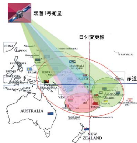
図2. 親善衛星の概略図