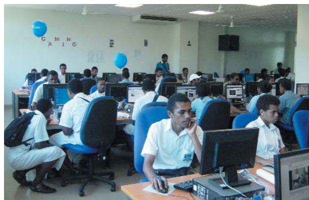
写真2. 高校生に開放されたコンピュータ研究室

大学理事会ではこのセンターを Regional Centre of Excellence for ICTと宣言しており、ここを起点として最先端技術の研究、高度な技術教育の実現によりこの南太平洋地域が、下記のICT分野で世界進出を支援するとされている。島嶼国は各国の人口が少ないため、高等教育施設及び大学の設置・運用が困難であり、教育を受けるには国外への渡航が一般的である。大学の一般公開日に高校生に開放したコンピュータ研究室の風景を写真2に示す。