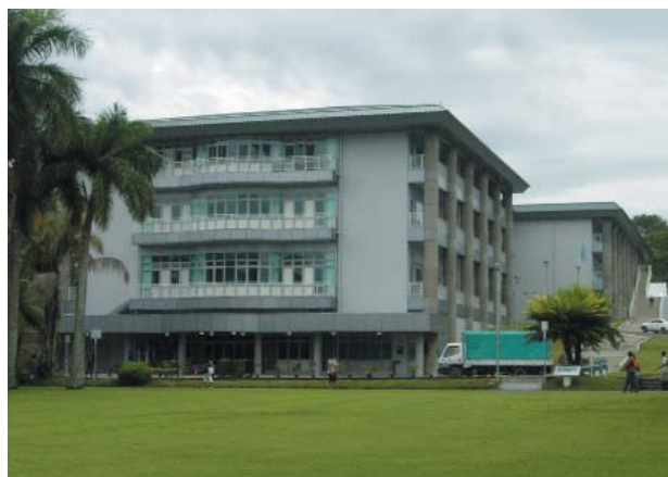
写真1. 完成されたICT Center2棟

第2期工事の多目的講堂は現在進行中であり、2011年末の完成予定である。完成された建物2棟はコンピュータ設備を整備した実験・実習・研究を目的とした4室、サーバー室、ネットワーク運用管理室、遠隔教育用設備、テレビ会議室、情報通信技術 (ICT) 関連学部・大学院の教員室、管理部門、コールセンターなどが稼働し始めた。我が国の支援によ