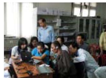
トライアル模様 (Luangphabang 県病院)

JTEC は、豊富な経験・ノウハウを活かした調査・研究・コンサルティング活動を通じ、情報通信インフラの整備に加え、その利活用を含めた“相手国の要望にマッチする ICT 環境改善”への取組みを積極的に進めています。