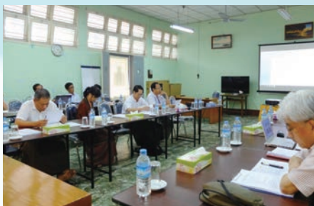
Consulting meeting in Myanmar ミャンマー通信網改善コンサルティング打合せ