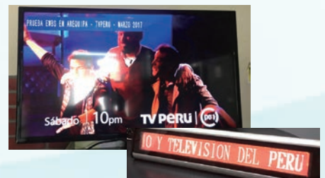
Display on TV screen and signage board テレビ画面と表示板