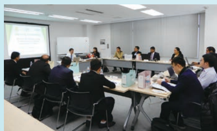
APT Training Course APT研修