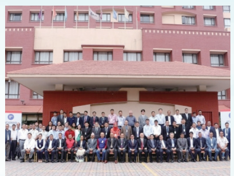
Participation to APT Meetings / APT諸国会への参加