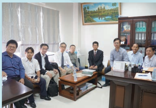
Survey on e-Health in Asia / アジア遠隔医療調査