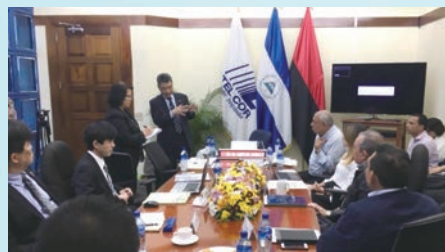
Presentation of EWBS at meetings / EWBSの説明