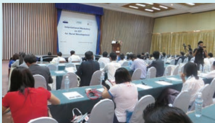
ICT Workshop in Myanmar / ミャンマー国際ICTワークショップ

ミャンマー情報通信視察ミッション・ワークショップ(2012) ミャンマー国際ICT ワークショップ(2014) IoT 啓発セミナー/ワークショップ(2017-)