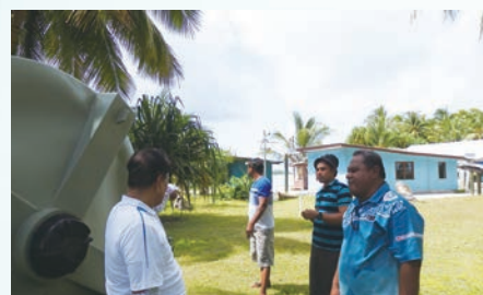
Dispatch of experts in Tuvalu ツバル国へ専門家派遣