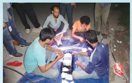
Consulting at sites in Bangladesh / バングラデシュ国での現場コンサルティング