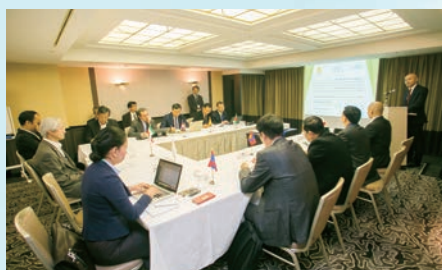
Training Workshop for High Level Officials 上級幹部研修