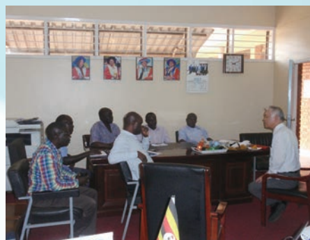
Survey telecoms in Africa / アフリカ通信事情調査