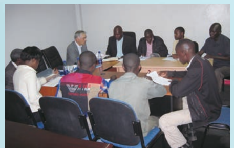
Survey on telecom cable construction works in Africa アフリカでの通信ケーブル工事調査