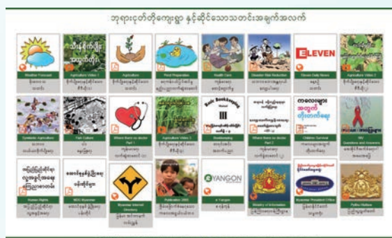
Myanmar "eVillage" Project / ミャンマーeVillageプロジェクト