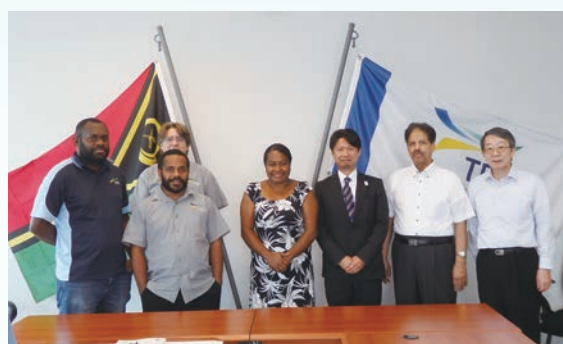
Survey in Oceania Country / 大洋州島嶼国現地調査