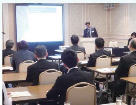
JTEC conferences & study meetings on overseas ICT development / JTEC国際展開講演会・研究会