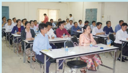
IoT awareness seminar & workshop / IoT 啓発セミナー・ワークショップ