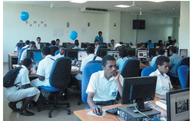
写真2. 高校生に開放されたコンピュータ研究室

大学理事会ではこのセンターを Regional Centre of Excellence for ICTと宣言しており、ここを起点として最先端技術の研究、高度な技術教育の実現によりこの南太平洋地域が、下記のICT分野で世界進出を支援するとされている。島嶼国は各国の人口が少ないため、高等教育施設及び大学の設置・運用が困難であり、教育を受けるには国外への渡航が一般的である。大学の一般公開日に高校生に開放したコンピュータ研究室の風景を写真2に示す。